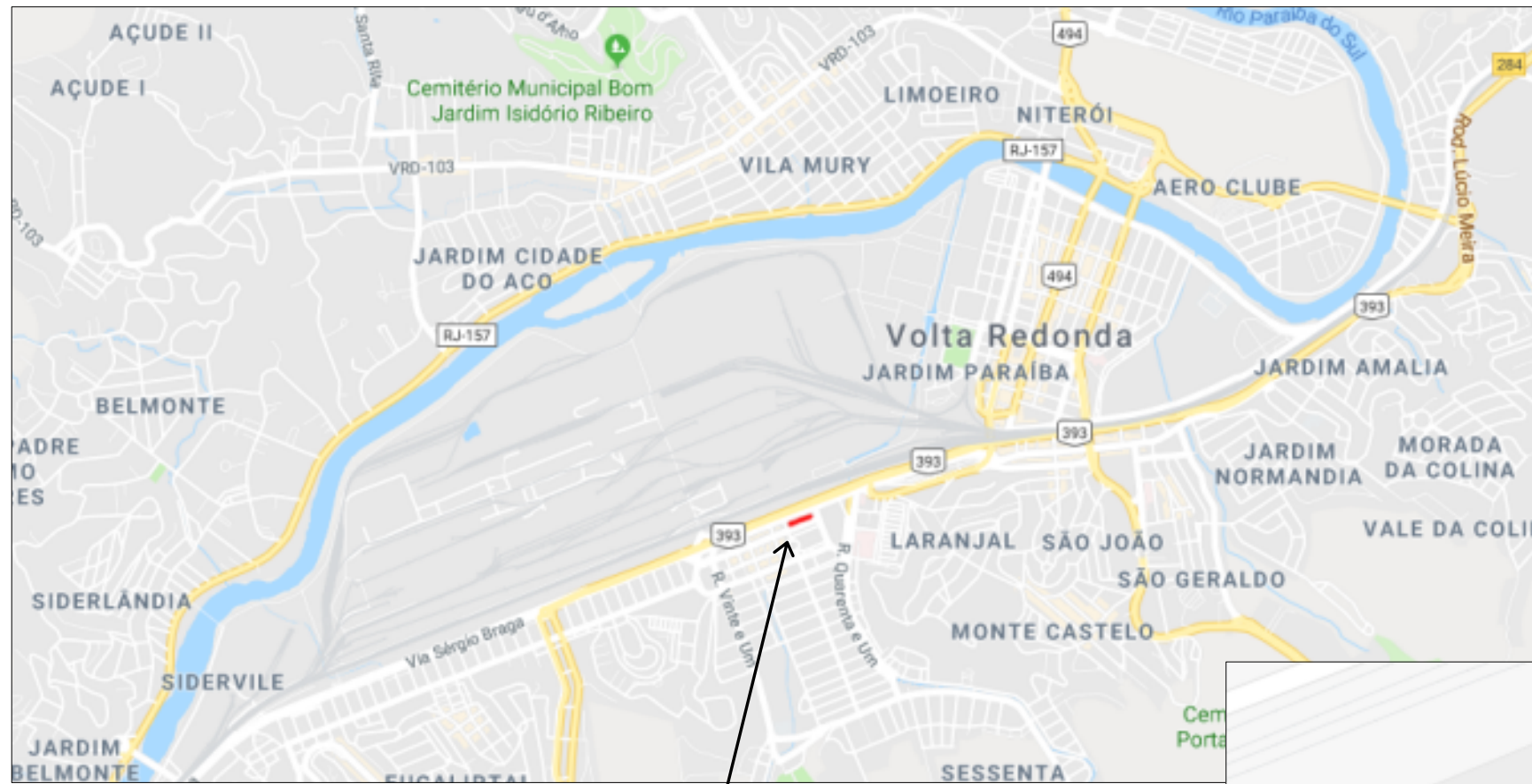
1 LOCALIZAÇÃO SEM ESCALA